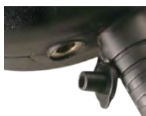
Ohrhöreranschluß 3.5 mm. 3.5 mm. connection

Mikrofontyp / Type of element: Kondensator Electret / Electric condenser Empfindlichkeit / Sensitivity: -62 dB Ausgangs-Impedanz / Output impedance: 2KΩ