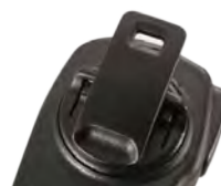
Drehbarer Befestigungsclip Rotating clip