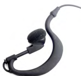
Patentierter Ohrhörer Patented ear-hook